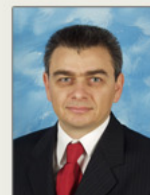
Καβουσανός Εμμανουήλ, Ph.D Καθηγητής Χρηματοοικονομικής, Τμήμα Λογιστικής και Χρηματοοικονομικής, Οικονομικό Πανεπιστήμιο Αθηνών