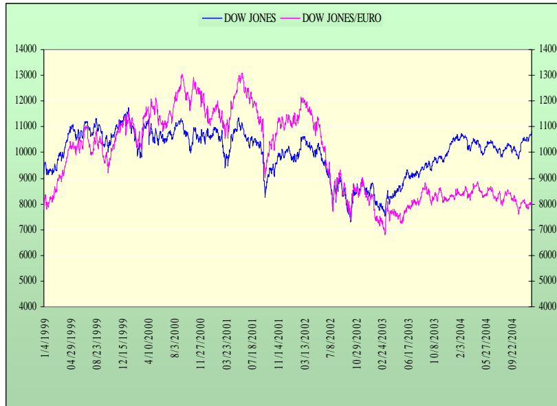
ΓΡΑΦΗΜΑ 4: Dow Jones/$ Μειον Dow Jones/Ευρώ – Ευρώ

Το συμπέρασμα λοιπόν αυτής της σύντομης γραφικής περιήγησης είναι ότι το ράλι των αγορών μετοχών στις ΗΠΑ αποτελεί καθαρά και μόνο αμερικανική υπόθεση. Οι ξένοι επενδυτές δεν έχουν αποκομίσει κανένα όφελος καθ’ όλη τη διάρκεια της ανόδου από τα χαμηλά του 2002. Αν και αυτό δεν αναιρεί την μεσοπρόθεσμη τάση της αμερικανικής αγοράς (βλέπε Special Report 29/1/2004) η οποιαδήποτε περαιτέρω ανατίμηση του ευρώ μόνο πονοκέφαλο θα φέρει στους ευρωπαίους.