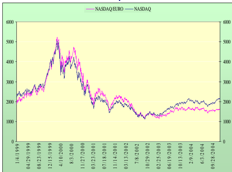
ΓΡΑΦΗΜΑ 5: Nasdaq Comp./$ Μειον Nasdaq Comp./Ευρώ – Ευρώ