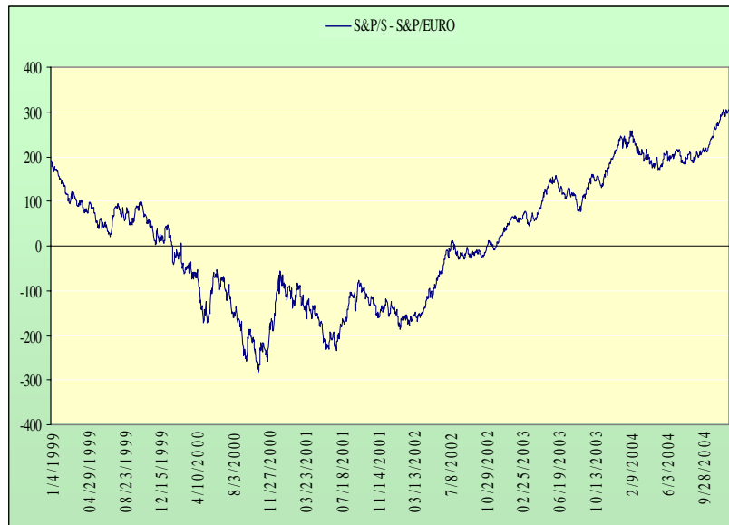
ΓΡΑΦΗΜΑ 2: S&P/$ Μειον S&P/Ευρώ

ευρώ) δεν είχε καμία συνέπεια στις τιμές των μετοχών παρά το γεγονός ότι τα θεωρητικά ακριβότερα αμερικανικά προϊόντα θα έφερναν