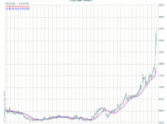
ΠΛΑΤΙΝΑ: ΜΗΝΙΑΙΑ ΤΙΜΗ ΔΙΑΠΡΑΓΜΑΤΕΥΣΗΣ (δολ. / ουγγιά) Περίοδος 31/05/1988-13/03/2008