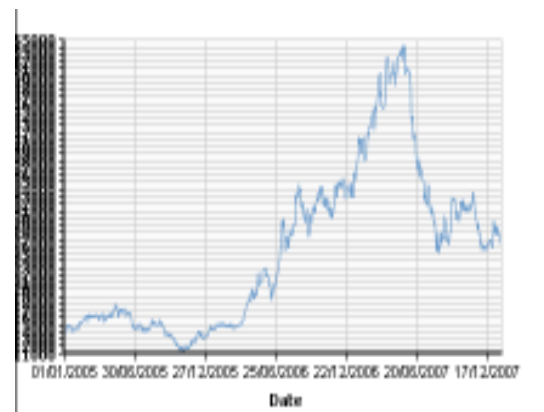
ΝΙΚΕΛΙΟ: ΗΜΕΡΗΣΙΑ ΤΙΜΗ ΣΤΗΝ ΑΓΟΡΑ ΜΕΤΡΗΤΟΙΣ ΠΕΡΙΟΔΟΣ 01/01/2005 - 23/01/2008, δολάρια/τόνο

© Οι εκτιμήσεις για το 2008 αναφέρουν ότι η συνολική χρήση του μετάλλου θα διαμορφωθεί σε 1.503.000 τόνους, αυξημένη κατά 6,07% σε σχέση με το 2007, ενώ οι δυνάμεις της προσφοράς εκτιμάται ότι θα κινηθούν επίσης ανοδικά κατά 7% και το απόλυτο μέγεθος θα διαμορφωθεί στους 1.523.000 τόνους. Τα αποθέματα του μετάλλου εκτιμάται ότι θα κινηθούν ανοδικά στους 114.000 τόνους, έναντι 94.000 τόνους για το 2007. Οι εκτιμήσεις για την αγορά του μετάλλου προβλέπουν ότι οι δυνάμεις της προσφοράς θα ξεπεράσουν σταδιακά τις δυνάμεις της ζήτησης, με αποτέλεσμα οι προβλέψεις του ABARE για την τιμή του μετάλλου να είναι πτωτικές για το 2008 και έπειτα. Πάντως, για φέτος, το ABARE δίνει τιμή για μέταλλο στα 27.500 δολάρια μετρικό τόνο, από 37.421 δολάρια τον τόνο για το 2007, στην ανάλυση του Δεκεμβρίου του 2007.