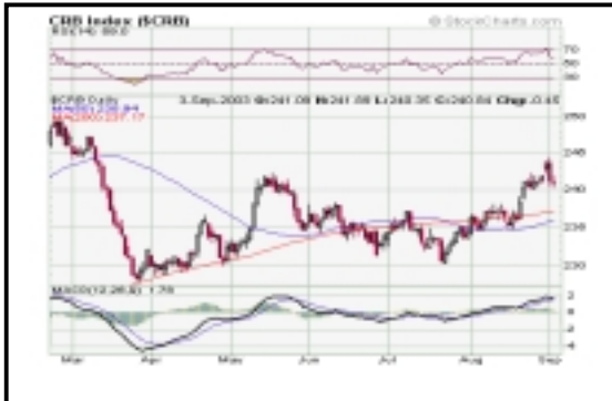
ΓΕΝΙΚΟΣ ΔΕΙΚΤΗΣ ΕΜΠΟΡΕΥΜΑΤΩΝ CRB