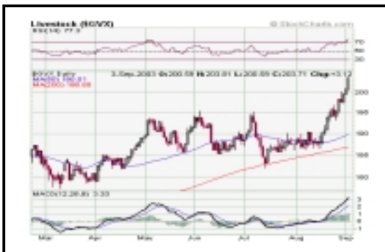
ΓΕΝΙΚΟΣ ΔΕΙΚΤΗΣ ΖΩΝΤΩΝ ΕΜΠΟΡΕΥΜΑΤΩΝ