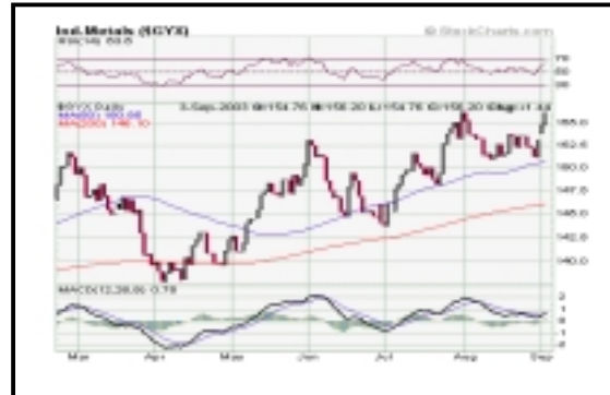
ΓΕΝΙΚΟΣ ΔΕΙΚΤΗΣ ΒΙΟΜΗΧΑΝΙΚΩΝ ΜΕΤΑΛΛΩΝ