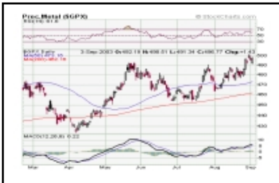
ΓΕΝΙΚΟΣ ΔΕΙΚΤΗΣ ΠΟΛΥΤΙΜΩΝ ΜΕΤΑΛΛΩΝ