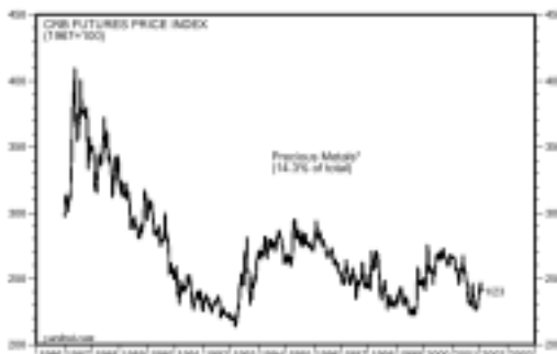
ΓΕΝΙΚΟΣ ΔΕΙΚΤΗΣ ΠΟΛΥΤΙΜΩΝ ΜΕΤΑΛΛΩΝ