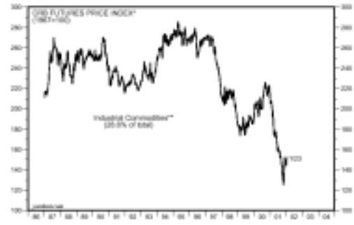
ΓΕΝΙΚΟΣ ΔΕΙΚΤΗΣ ΒΙΟΜΗΧΑΝΙΚΩΝ ΕΜΠΟΡΕΥΜΑΤΩΝ