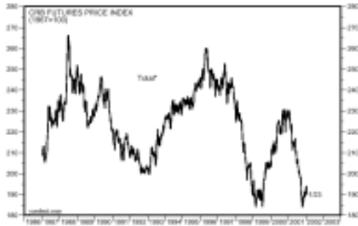
ΓΕΝΙΚΟΣ ΔΕΙΚΤΗΣ ΕΜΠΟΡΕΥΜΑΤΩΝ CRB